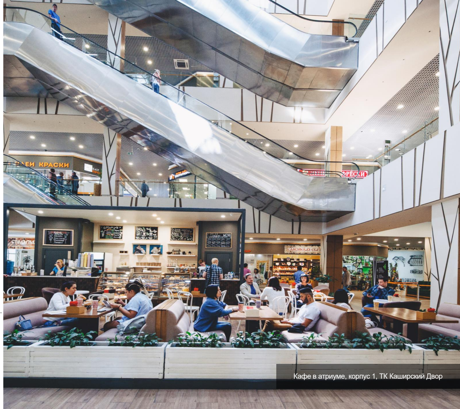
Кафе в атриуме, корпус 1, ТК Каширский Двор